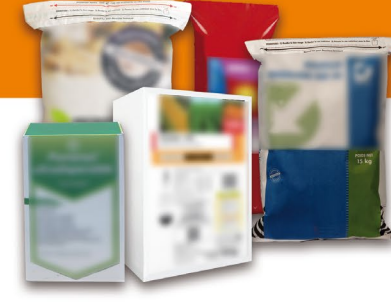
Produits phytopharmaceutiques et fertilisants