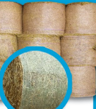
Conditionnement balles rondes