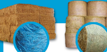
Conditionnement des fourrages, palissage vigne et horticulture