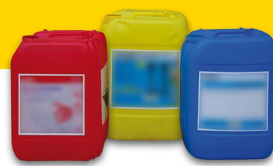
Produits d'hygiène de l'élevage laitier