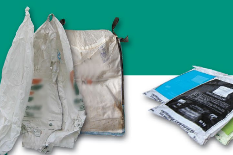
Engrais, amendements, et semences