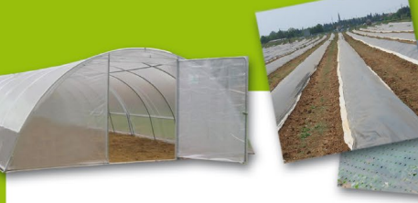
Couvertures de serres