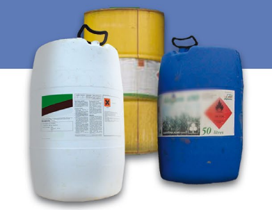
Produits phytopharmaceutiques et fertilisants