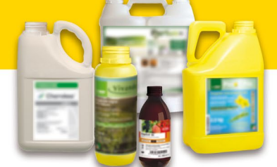
Produits phytopharmaceutiques et fertilisants