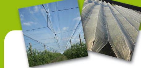
Protection des cultures arboricoles